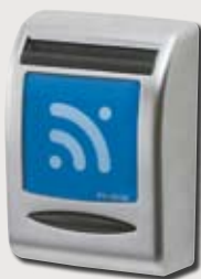
Dual-Leser, Magnetkarten und 13,56 MHz Transponder